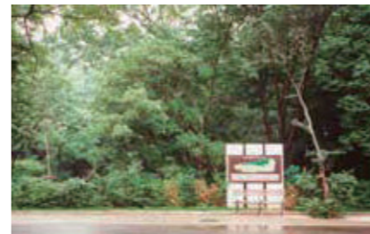
【写真1】西ゾーン開発前の様子 (1994年)

その最初の建物になったのは、1995年（平成7）に復元された田園調布の家（大川邸）です。【写真2】この建物にもともとお住まいだった大川ご一家は、建築当時の図面類や、工事中の記録写真