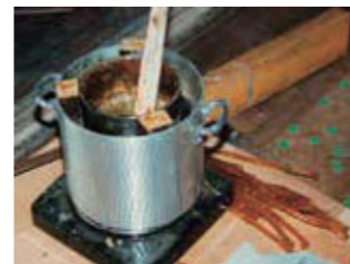
【写真5】床板をはるための膠を煮ているようす (1994年)