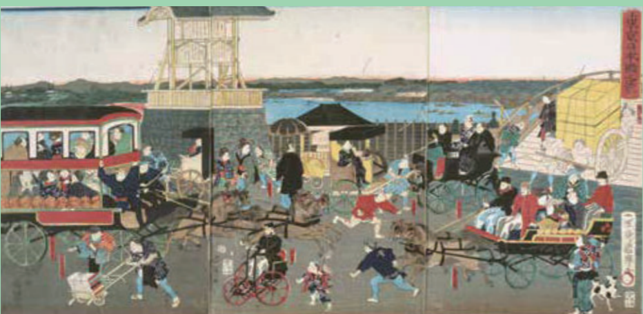
東京日本橋之景（展示期間：5/28～7/7）

江戸から明治へと移り変わると、駕籠や「乗物」は姿を消します。その様相は当時の日本橋などの名所を描いた錦絵に窥えます。画題には自転車や馬車が登場