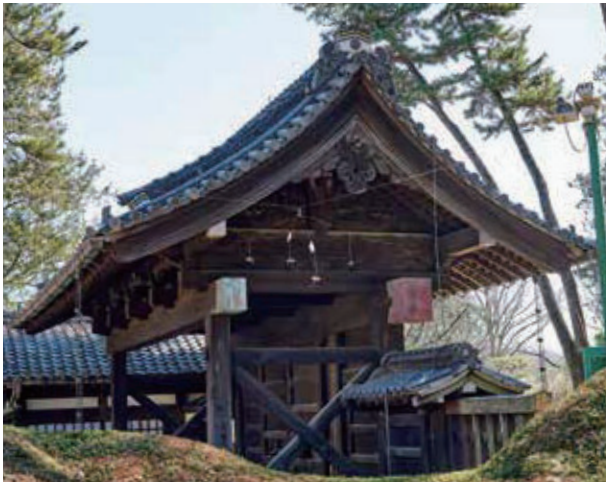
「伊達家の門」とオニヤンマ君 (中心付近)

今回お話しするのは、そんな虫害の中でも危険性が最も高いスズメバチについてです。数年前から毎年、復元建造物の「伊達家の門」周辺でスズメバチの姿が多くみられるようになりまして。どうやら「屋根内部に巣を作られて