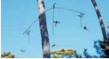
風を受けて回るオニヤンマ君