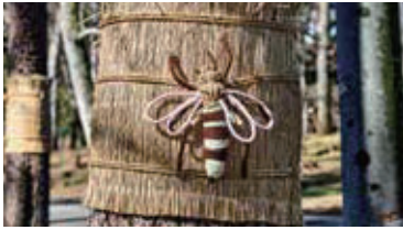
スズメバチのこも巻き飾り

しまったようです。スズメバチ自体は建築に対して直接的に大きな被害を与えるわけではありませんが、付近を通る人の安全を考えると対処が必要です。巣そのものの撤去は屋根の解体をしなければならぬので最終手段として、周辺に罠を設置したり、蜂の出入り口と思われる建築の隙間や穴を塞いだりと毎年手を尽くしましたが良い効果は得られませんでした。そこで今年度は巷で話題になっているスズメバチの天敵であるオニヤンマを模した虫よけグッズの「オニヤンマ君」を投入。風に揺られてくるくと回るオニヤンマ君に恐れをなしたのか今年度は伊達家の門にスズメバチが寄り付くことはありませんでした。実際の効果は分からないので様々な手段を継続的に続けていく必要がありますが、今年度に関しては「オニヤンマ様様」でした。