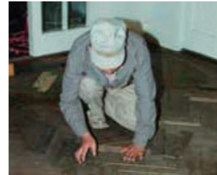
【写真4】居間の寄木張り (1994年)