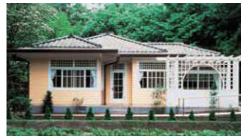
【写真6】完成した大川邸