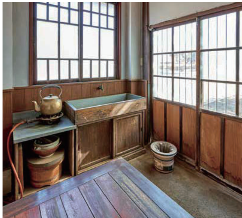
正面脇に配された台所