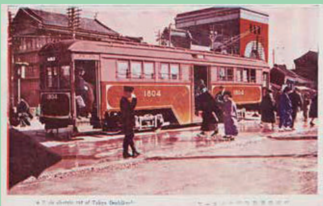
絵葉書 東京市電気局最新式ボギー車

〈東京都江戸東京博物館は、ただいま大規模改修工事を行っています。あらたな魅力をともなった博物館となって、2025年度に再開することを目指しています。〉