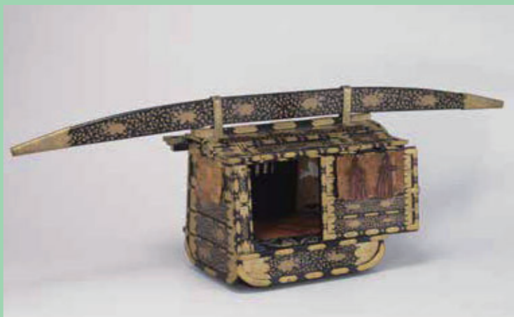
黒塗牡丹唐草蒔絵雑道具 女乗物

乗り物に関するコレクションとして、まず掲げられるのは江戸東京博物館の常設展示室を飾る女乗物ほかの江戸時代の「乗物」です。江戸時代以前、乗り物と言えば、牛車・輿・駕籠などさまざまなものがありました。このうち江戸では、露出して乗車し、腰をおろす床が狭い駕籠と屋根や四壁を持つ「乗物」が主でした。どの場合も自走するものではなく、動力には人がかかっていました。