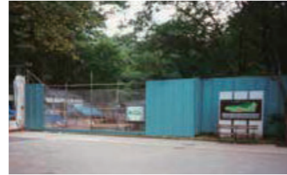
【写真2】大川邸工事開始 (1994年)