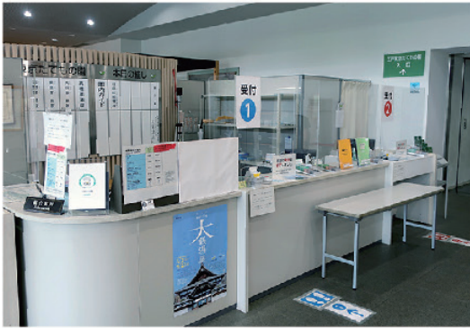
インフォメーションカウンター