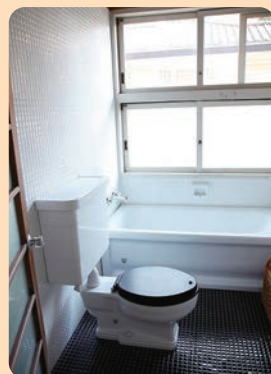
まえわくに おてい 前川男邸 1942年(昭和17)／建築