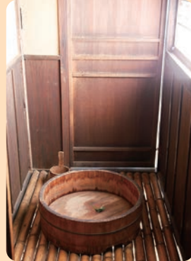
はちおうじ せん いん にん どう しん く み が しら 八王子千人同心組頭の家 江戸時代後期／建築

たてもの園 えん の中には、おふろが い つ いで い る家 おな が多 い い え けれど、おふろ がない家 おな も多 い か つ つた の です。あな たは、どの家 おな のおふろに入 お って み たい お と思 おも いますか。