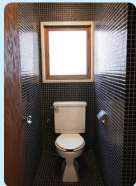
前川男邸 1942年(昭和17)／建築