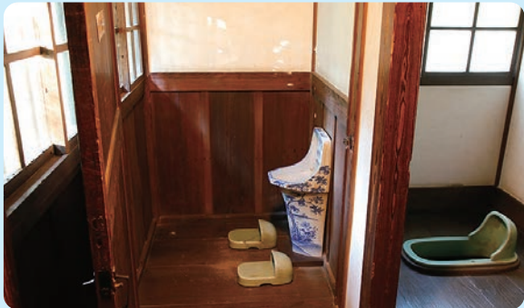
天明家 18世紀後半／建築

むかしのべんじょは、暗くてくさいことも多かったようです。し尿は、ためておいて、肥料 けりょう に使われることもあり、水道 すいどう が引かれると、水洗べんじょがつくられるようになりました。