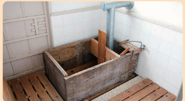
ときわ だいしゃしんじよう 常盤台写真場 1937年(昭和12)／建築