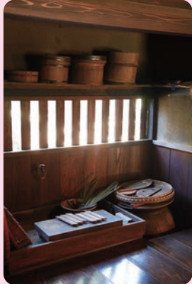
つなしまけ 綱島家 江戸時代中期／建築

むかしは、すわり なが 流し いって と い って、だ いどころ しごと 仕事も ゆか 床に おな すわ なが って だい や って つか いました。その後、いま おな と同じ い よ うな た 立 さ って ぎ 作 ぎ 業 よう が な で い き る 流 なが し だい 台 い 使 つか わ れ る よ う に な り ま し た。