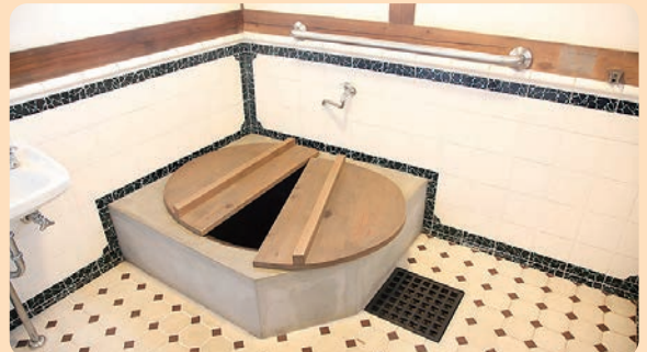
にしかわ け べつてい 西川家別邸 1922年(大正11)／建築