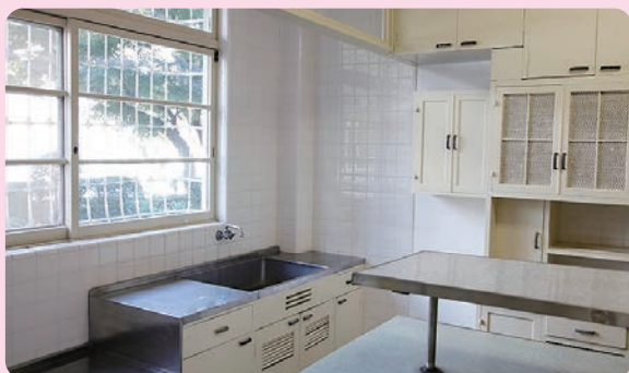
みついはちろうえもんてい 三井八郎右衛門邸 1952年(昭和27)／建築