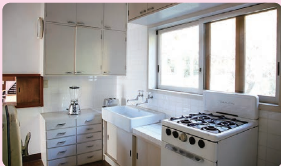
まえわくに おてい 前川男邸 1942年(昭和17)／建築