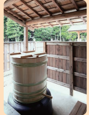
まんたくりよかん 万徳旅館 江戸時代末期～明治時代初期／建築