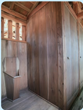
万徳旅館 江戸時代末期～明治時代初期／建築