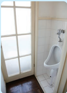
田園調布の家(大川邸) 1925年(大正14)／建築