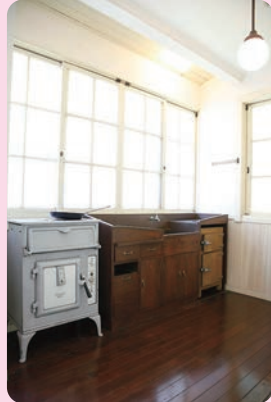
でんえんちようふ 田園調布の家(大川邸) 1925年(大正14)／建築