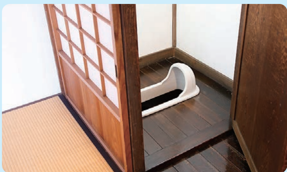
小出邸 1925年(大正14)／建築