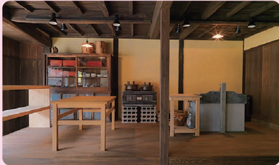
まんたくりよかん 万徳旅館 江戸時代末期～明治時代初期／建築