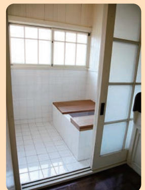
でんえんちようふ 田園調布の家(大川邸) 1925年(大正14)／建築