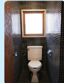
10 前川國男邸 1942年(昭和17) / 建築