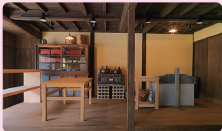
2 万徳旅館 江戸時代末期～明治時代初期 / 建築