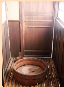
4 八王子千人同心組頭の家 江戸時代後期 / 建築

たてもの園の中には、おふろがつ いている家が多いけれど、おふろ がない家も多かったのです。あな たは、どの家のおふろに入ってみ たいと思いますか。