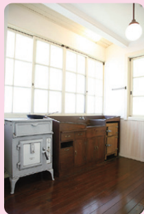
3 田園調布の家(大川邸) 1925年(大正14) / 建築