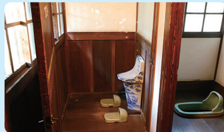
8 天明家 18世紀後半 / 建築

むかしのべんじょは、暗くてくさい ことも多かったようです。し尿は、 ためておいて、肥料 ひりょう に使われるこ ともありました。水道 すいどう が引かれる と、水洗べんじょ すいせんべんじょ がつけられるよ うになりました。