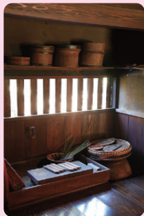
1 綱島家 江戸時代中期 / 建築

むかしは、すわり流し なり といって、だ いどころ仕事も床にすわってやっ ていました。その後、いまと同じよ うな立って作業 さぎょう ができる流し台 だい が 使われるようになりました。