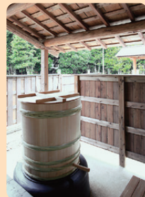
5 万徳旅館 江戸時代末期～明治時代初期 / 建築