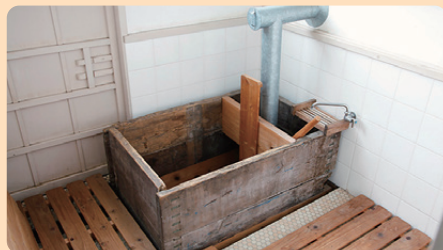
常盤台写真場 1937年(昭和12) / 建築