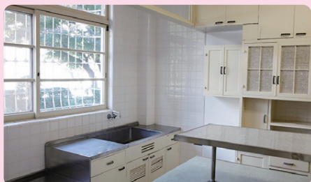
三井八郎右衛門邸 1952年(昭和27) / 建築