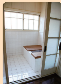
6 田園調布の家(大川邸) 1925年(大正14) / 建築