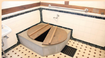
7 西川家別邸 1922年(大正11) / 建築