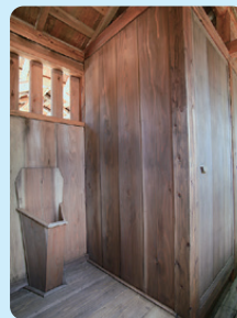
万徳旅館 江戸時代末期～明治時代初期 / 建築