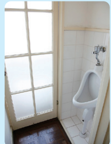
田園調布の家(大川邸) 1925年(大正14) / 建築