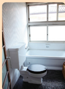
前川國男邸 1942年(昭和17) / 建築